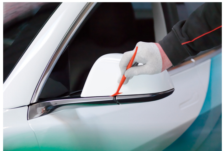
Hervorragende Verformbarkeit für schwierige Fahrzeugfolierungen – auch für größere Flotten.

Wenden Sie sich für weitere Informationen an Ihren Verkaufsvertreter oder besuchen Sie die Website von Avery Dennison unter: graphics.averydennison.de/sp1504