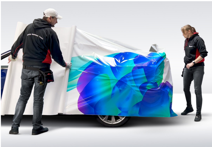
Die Easy Apply™ Technologie und eine geringe Anfangshaftung ermöglicht das einfache Repositionieren der Folie.